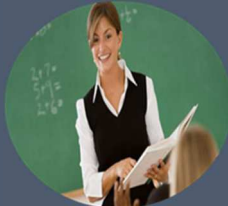
ÖĞRETMENLİK: 300 BİN