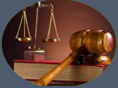
HUKUK EA:190 BİN