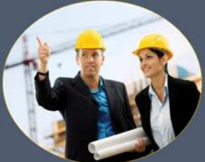
MÜHENDİSLİK SAYISAL: 300 BİN