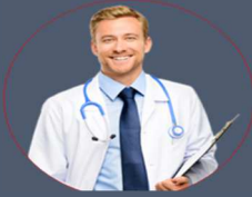
TIP SAYISAL:50 BİN