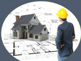
MİMARLIK SAYISAL: 250 BİN